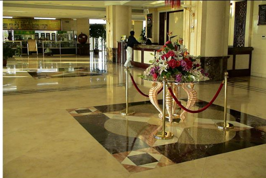
Recepção de hotel: cursos têm início em setembro

Para aqueles que moram em Tamararé – a cerca de 100 quilômetros ao Sul de Recife, em Pernambuco – e estão buscando uma oportunidade para se qualificar e inserir no mercado de trabalho, o Portal Sul Consórcio inicia parceria com o SENAC-PE na realização de dois cursos gratuitos: Condutor Ambiental Local e Recepcionista em Meios de Hospedagem. As aulas acontecem de segunda a sexta-feira no CEPENE – Centro de Pesquisa do Nordeste, localizado na rua Dr. Samuel Hardman, s/n. As vagas são limitadas, e as inscrições estão abertas até dia 24 de agosto neste site .