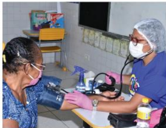
Mais notícias de Barreiros na página 7