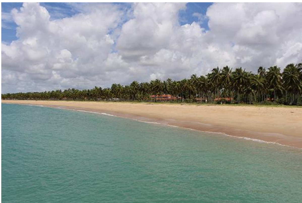
Praias mais seguras no sul de Pernambuco

ago 18, 2020 editorial Destaques , Destinos 0